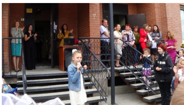
На фото: торжественная линейка, Линейная, 51

А у наших художников радость двойная: первая встреча в новом здании на Кропоткина, 116! В последние недели каникул, силами преподавателей, здание по ул. Кропоткина 116 было приведено в порядок, и распахнуло свои двери для юных художников. Но, в нескольких классах звучат звуки фортепиано и слышны звонкие песни. Вместе с художниками здесь занимаются и маленькие музыканты. Пожелаем творческих успехов в новых стенах нашим ученикам.