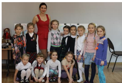
На фото первый класс ДПИ

Преподаватели художественного отделения поучаствовали в праздничном мероприятии - Губернаторском бале первоклассников: 5 сентября в театре «Глобус» было шумно, весело и интересно. Мы провели мастер-классы по созданию аппликации, аква-гриму и созданию