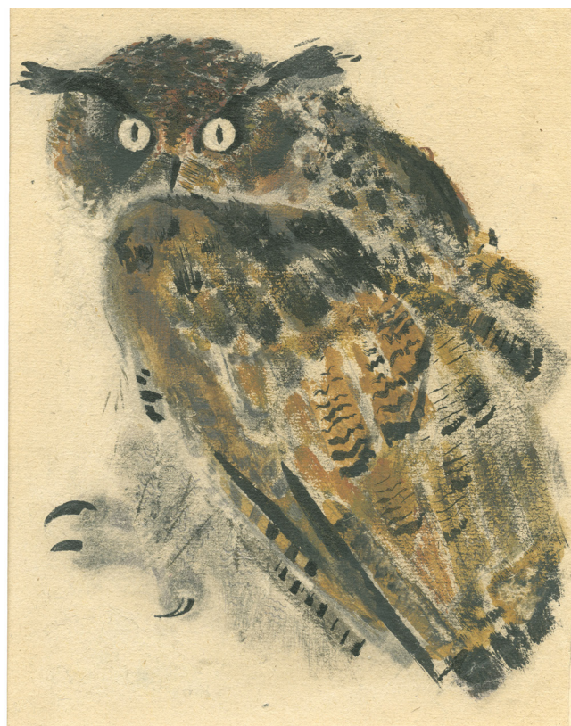
Иллюстрация Евгения Чарушина к книге «Вольные птицы», 1929 г.

Такая же история с фотографиями. К сожалению, мы вновь столкнулись с большим количеством копий. Одни и те же фотографии становились образцами для работ в разных номинациях и возрастных группах.