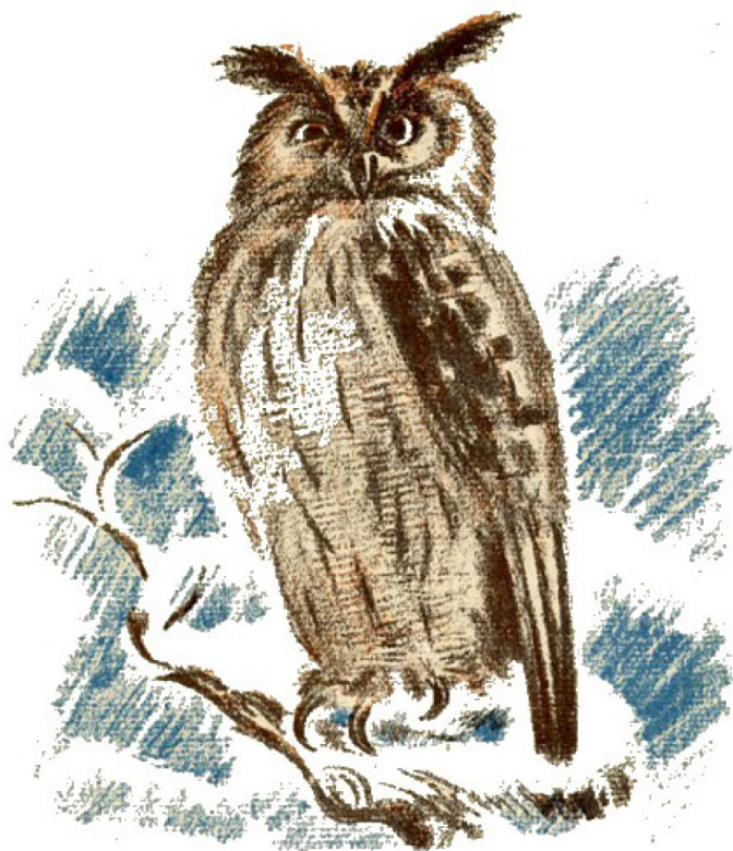
Иллюстрация Николая Тырсы к книге Виталия Бианки «Снежная книга», 1926 г.

Похвально изучение произведений классиков детской литературы, выдающихся художников советского периода и современности. Но, как я писала в комментариях к конкурсам прошлых лет, заимствование чужих композиционных, колористических, технических решений не является самостоятельным, индивидуальным творчеством. Члены жюри — профессиональные художники, которые с первого взгляда на работу могут определить, придумана и выполнена она самостоятельно, или же идея заимствована. Особенно, если она заимствована у классиков.